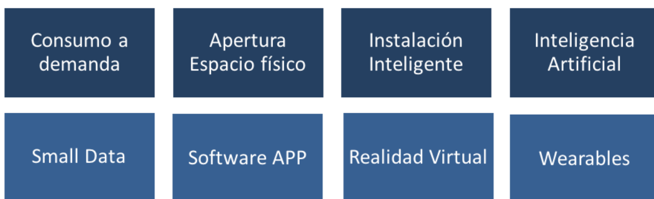
Figura 2. Nuevos retos del sector deportivo en la revolución digital.

Finalmente han aparecido nuevas herramientas como el análisis de datos (small data), las aplicaciones y software específicos, la realidad virtual y la tecnología portátil vestible (wearables), que aún teniendo una escasa penetración actualmente, se convertirán en los próximos años, en una opción imprescindible que alterarán la prestación de nuestros servicios, la relación con los usuarios y los modelos de negocio.